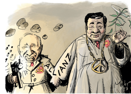
Fremde fürs Leben